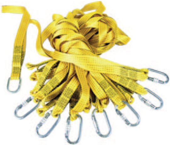
Imagen: A. Marcelino.