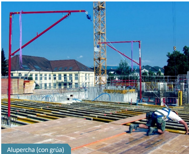
Alupercha (con grúa)