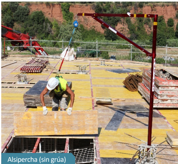
Alsipercha (sin grúa)